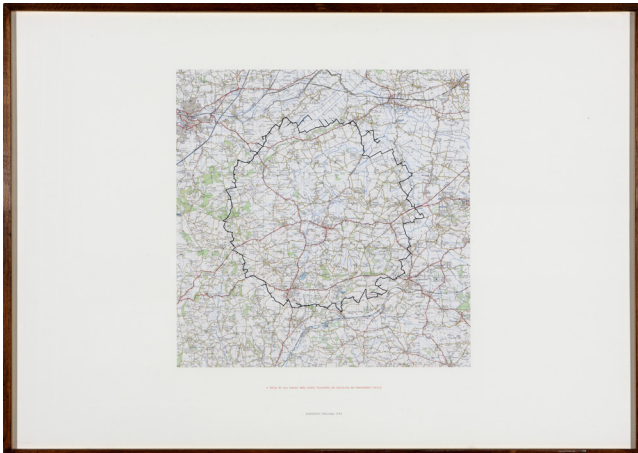
Richard Long A Walk By All Roads And Lanes Touching Or Crossing An Imaginary Circle

Land Art is een kunststroming waarbij kunstenaars hun werk construeren in direct fysiek contact met de - dikwijls ongerepte - natuur. Heel vaak wordt het werk in de natuur gemaakt en schiet er enkel documentatiemateriaal over. In dit voorbeeld kan je zien dat de kunstenaar een wandeltocht heeft proberen maken in de vorm van een cirkel. De kunstenaar heeft tijdens zijn wandeling deze cirkel getekend op een landkaart.