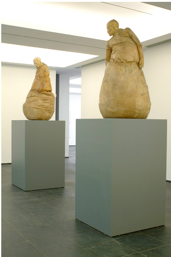
Juan Muñoz Two Watchmen