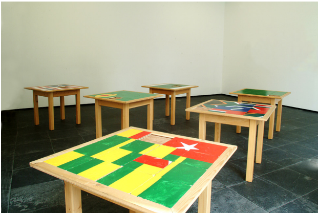
Meschac Gaba Democracy Game

Deze tafels dienen eigenlijk niet als tafel maar als schuifpuzzel. Als bezoeker word je uitgenodigd om de verschillende vlaggen van Algerije, Angola, Tsjaad, Marokko, Senegal en Seychellen te vormen. We kennen een vlag als nationalistisch symbool en bakent op een bepaalde manier een grens van een land af. Het verschil met een echte vlag is dat deze vlaggen 'gewrongen' zitten in de vierkante vorm van de tafel. Op die manier ontstaat er een bepaalde spanning die al spelenderwijs vragen stelt bij het 'verengende' mechanisme van nationalisme en politiek bestuur.