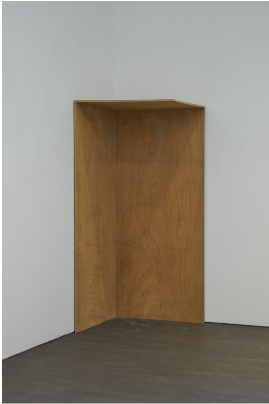
stanley brouwn Space Fragment