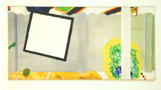
Roger Raveel De muur

Deze kunstenaar schildert heel graag de dingen die hij in zijn dagelijkse leven vaak tegenkomt en combineert dat met abstracte vormen. Op het schilderij is een betonnen muur te zien zoals men er vele vindt in typische Vlaamse verkaveling tuinen. Dit zou een 'doorkijk' kunnen zijn, in de vorm van een zwart omrand, wit vierkant.