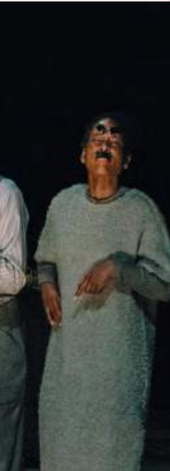
scènefoto 'Voorjaarsontwaken'

Praat je na een voorstelling graag nog even na in ons CCKaffee met een drankje in de hand? Dan helpen we je graag op weg!