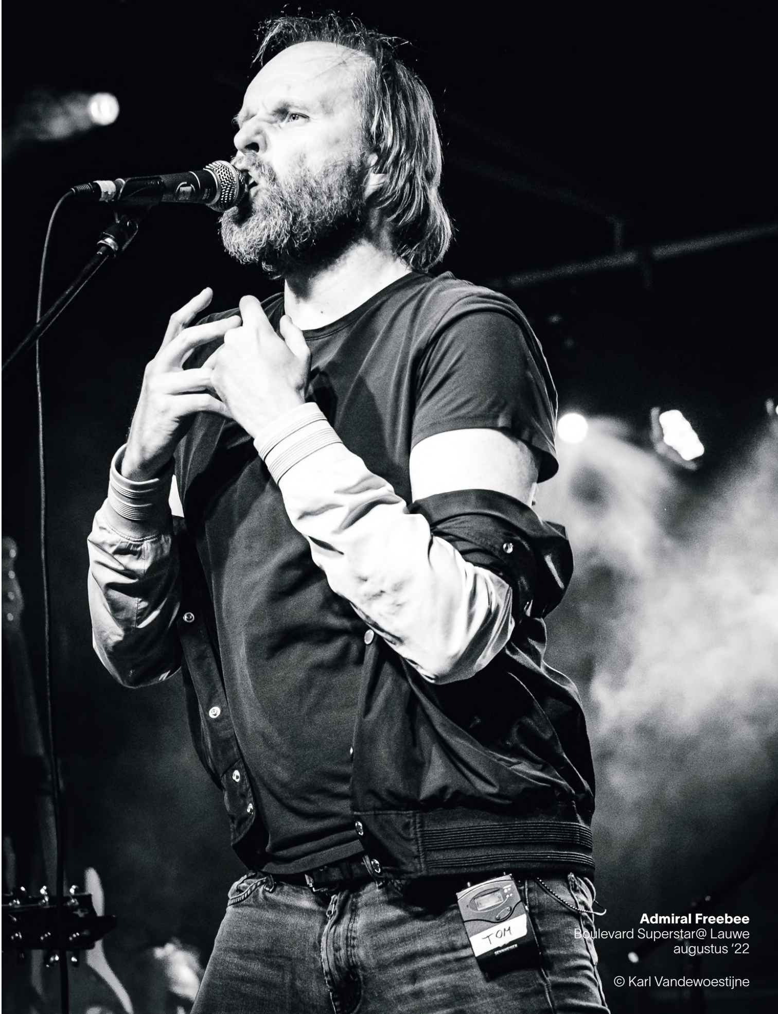
Admiral Freebee Boulevard Superstar@ Lauwe augustus '22