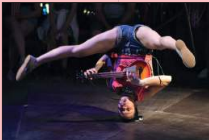
Circus I Love You