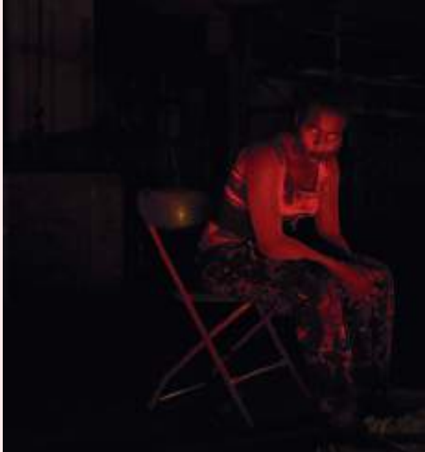
Scènefoto 'BITE ME'

“Dankzij het festival ontstaat een microklimaat waar generositeit tussen publiek en artiesten zegeviert.”