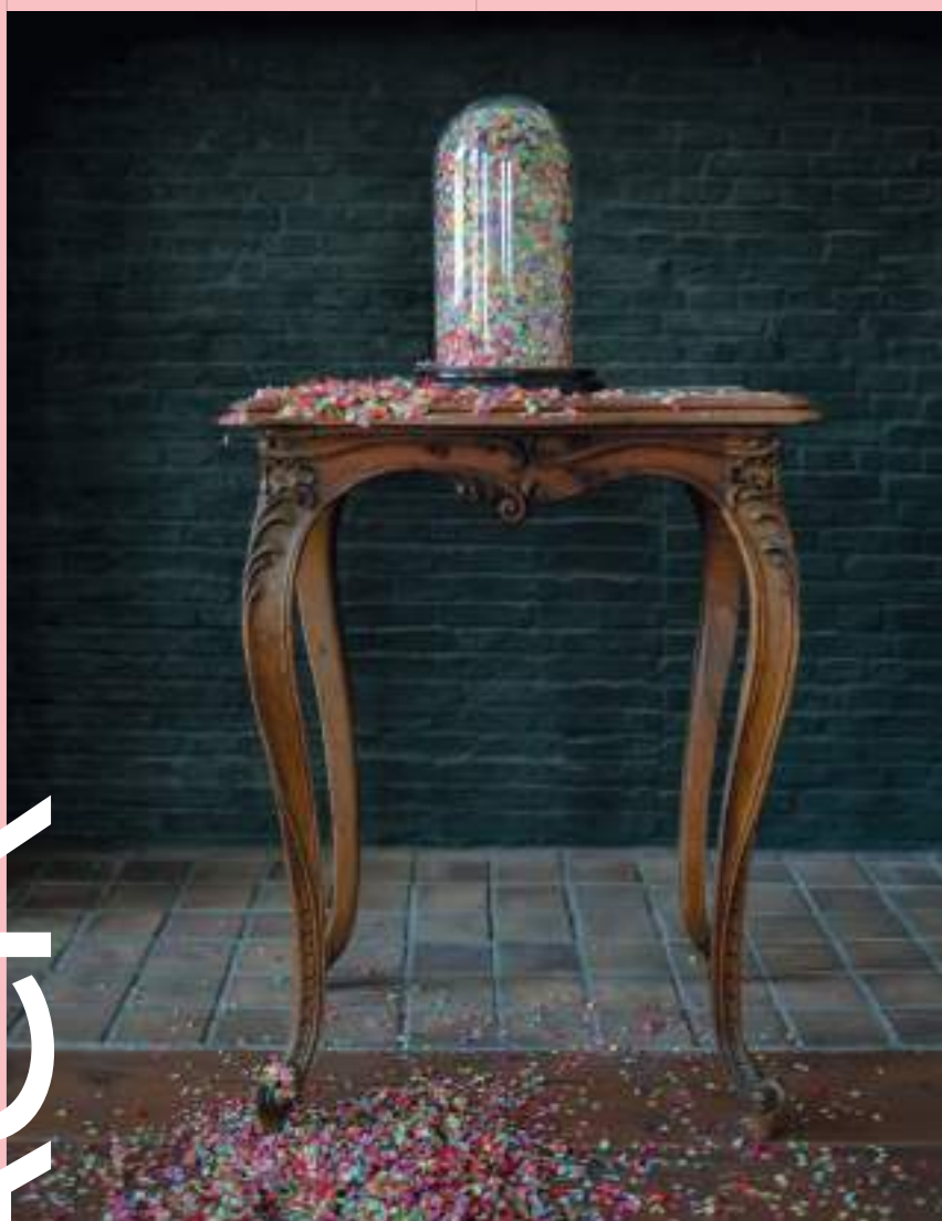
Mohammed Alani tentoonstelling 'DUETS'